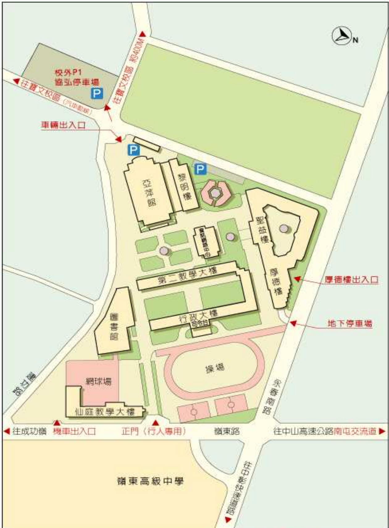
嶺東科技大學春安校區平面配置圖

※ 請參閱本校首頁 ( http://www.ltu.edu.tw ) 學校簡介交通說明